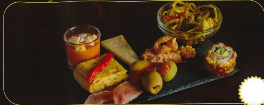
Leyendas Santa Quiteria, 2 / 669 923 507 ■ Cuando papá España conoció a mamá Asia básicamente es una Tapa representativa de las dos culturas.