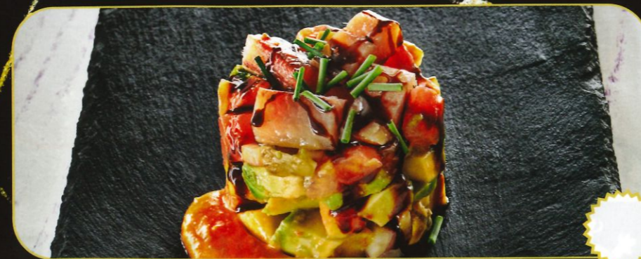
Salaburi Puerta de Abajo, 1 / 91104 37 77 ■ 3, 2, 1... Timbal! con salmorejo, tomate, cebolla, aguacate, sardina y alcaparra.