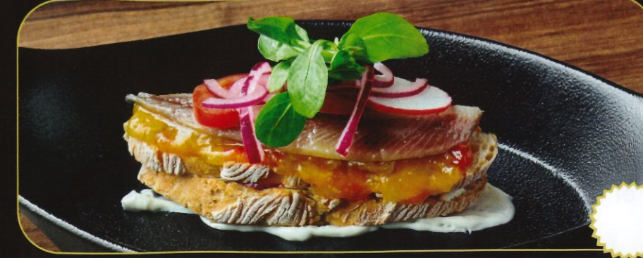
Valhalla Gourmet Puerta de Abajo, 2 / 662 937 797 ■ Fish gourmet lomo de sardina ahumada sobre un confit de mango.