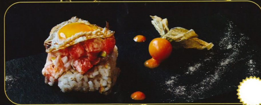
Rest. Mimo Collado Mediano, 4 / 600 728 904 ■ Tartar de salmón sobre arroz frito y huevo de codorniz.