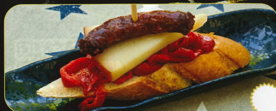
Casa Frutos Plaza de Guadarrama, 1 / 677 452 337 ■ Tosta Navarra txistorra queso Idiazábal D.O. y pimientos del Piquillo.