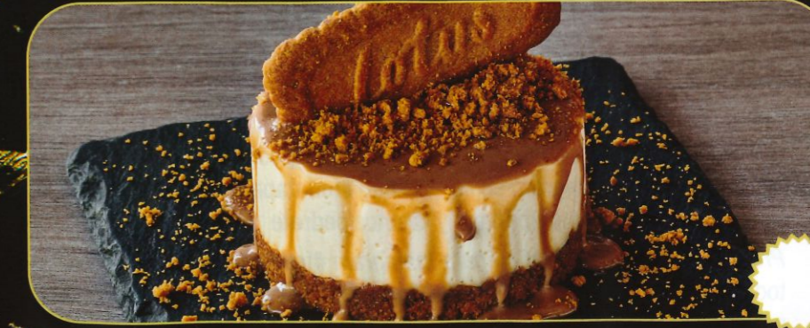
Cochoco Bakery Dr. Varela, 2, Local 1 / 660 675 427 ■ Lotus cheesecake tartaleta de queso con crema lotus, coronada con caramelo y galleta.