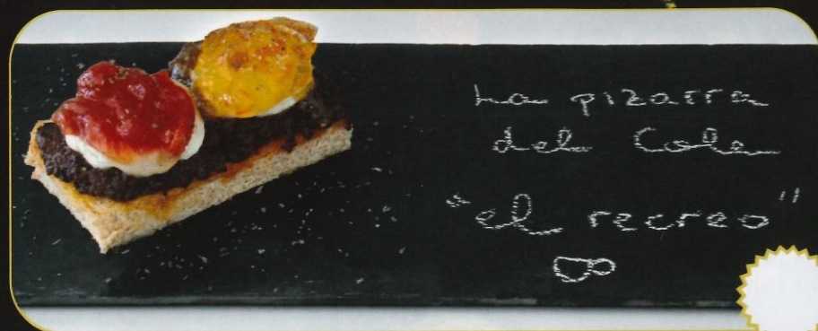
Café El Recreo Santa Emilia, 66 / 620 167 071 ■ La Pizarra morcilla, queso de cabra, pan de molde, mermeladas, cebolla caramelizada y albahaca.