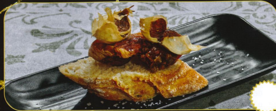
Mesón El Cabrero San Juan, 10 / 91 857 16 65 ■ Cochifrito cochinitillo frito con ajos de Las Pedroñeras.