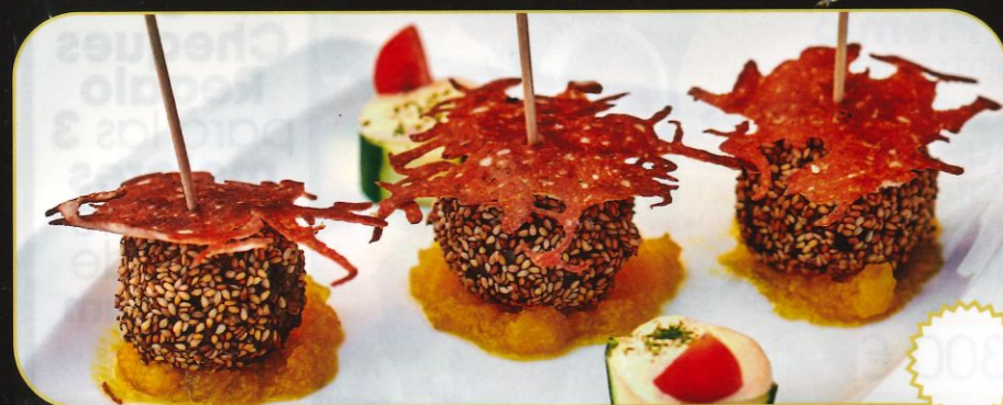
Cafetería Feijóo De la Primavera, 94 / 91 930 15 99 ■ Ferrero Rocher de morcilla con manzana confitada.