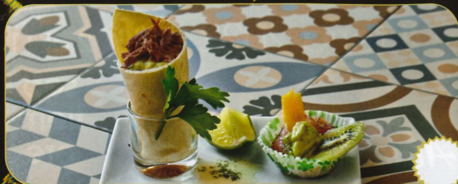
Bodega San Mateo Calle Real, 18 / 652 154 612 ■ De Europa a América paseando por Alpedrete.